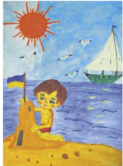
Малюнок Юрія Поліщука (11 років)