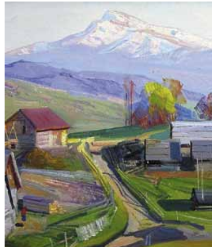
І. Шутєв. Говерла

Фактично частиною міста Запоріжжя нині став острів Хортиця, а це дорогий серцю кожного українця символ історії козацтва. Завдяки своєму стратегічному розташуванню Хортиця відіграла важливу роль у боротьбі нашого народу проти іноземних поневолювачів ( З посібника ).