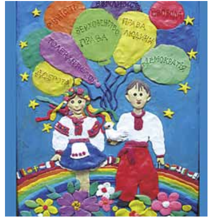
Плакат із пластиліну Ольги Муравко (15 років)