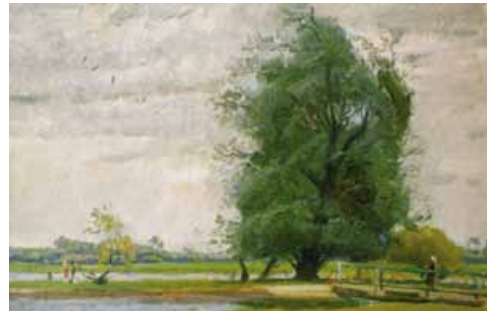
П. Григор'єв. Пейзаж

II. Напишіть твір-мініатюру (4–6 речень) на тему «Грайливий вітер» або «Вересень-жартівник», використавши дієслова в переносному значенні. За потреби скористайтеся лексичним матеріалом з довідки.